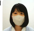
杉並区くらしのサポートステーション千葉さん

「杉並区社協を知る」学習会の2回目「自立支援に向けた取り組みについて」を開催。(杉並区)