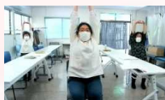
休憩時間は体操と脳トレ