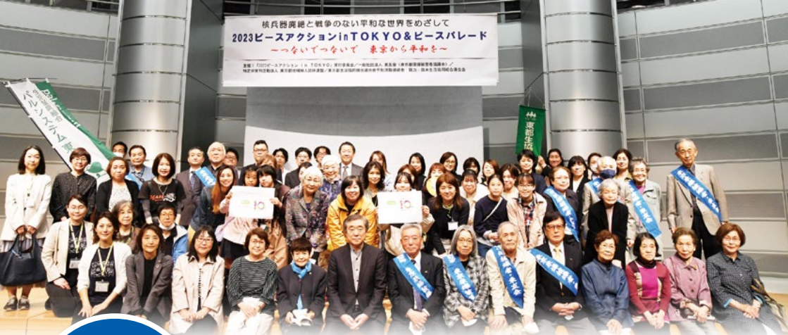
ピースアクション in TOKYO