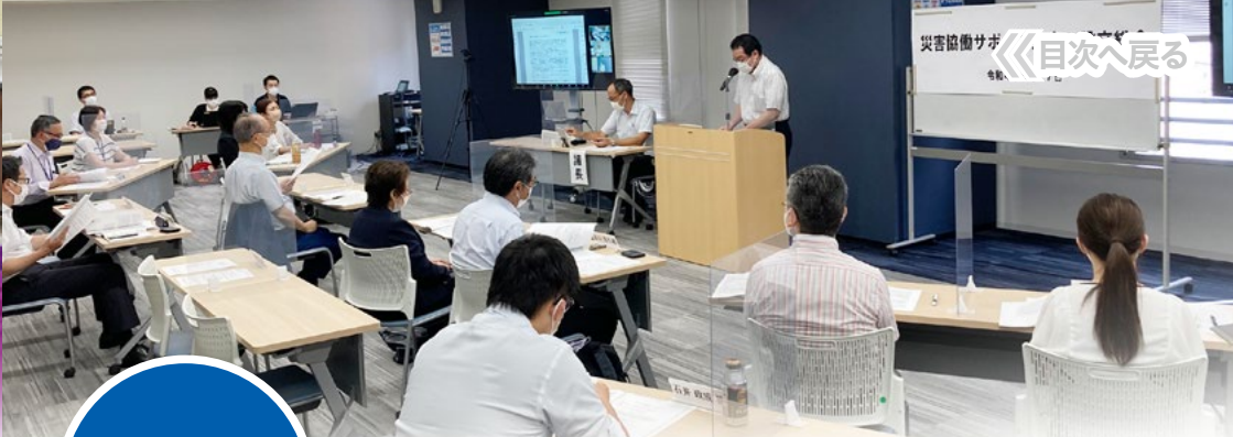
災害協働サポート東京設立総会