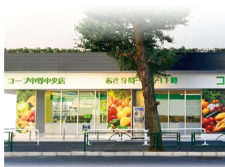
1階・2階 コープ中野中央店(コープみらい)

また、各種イベントや会議等に利用できる貸会議室があり、都内各生協や地域の皆さんが集い、交流する施設として活用いただいています。