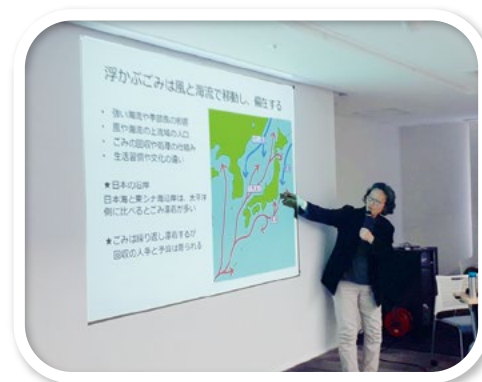
プラスチック問題学習会

また、「2050年の温室効果ガスの実質排出ゼロ」に向けて、会員生協や日本生協連と連携しながら情報収集や学習交流に取り組んでいます。