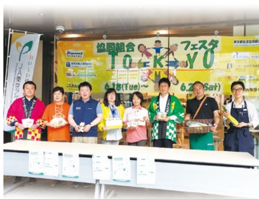
2019協同組合フェスタTOKYO

2012国際協同組合年を受けて、東京の9つの協同組合団体は「東京の協同組合間の協力と連携のあり方を考える連絡協議会」を立ち上げ、協同組合間の連携やネットワークづくりをすすめています。毎年連絡協議会を開催し、都民に東京の協同組合を知らせる取り組みや社会貢献活動等での連携を強め、都内協同組合の姿をアピールしています。