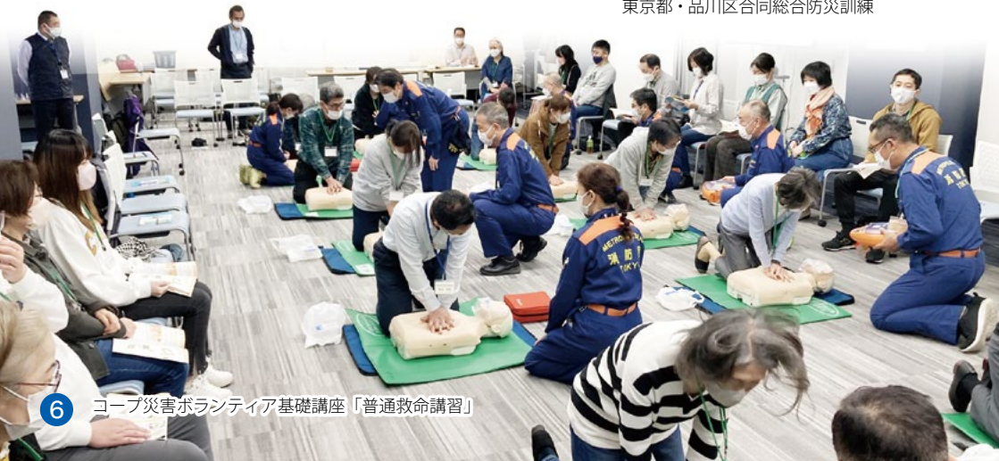
6 コープ災害ボランティア基礎講座「普通救命講習」