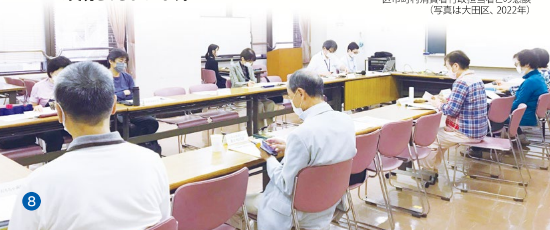
区市町村消費者行政担当者との懇談 (写真は大田区、2022年)