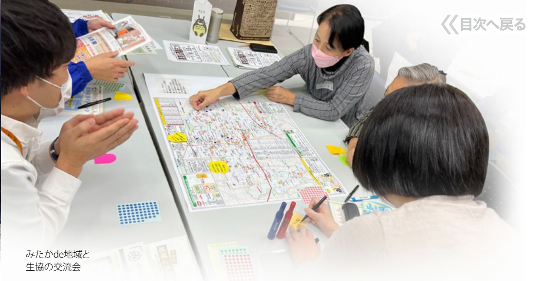
みたかde地域と 生協の交流会

各生協では行政や社会福祉協議会、地域の市民団体と連携し、居場所づくりや学習支援への運営協力をはじめ、生活に困っている方々への支援として、子ども食堂やフードバンクへの食材や物資の提供、配送時や店頭でのフードドライブ、フードパントリーの実施などの活動が広がっています。