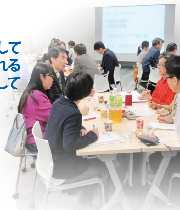
学習交流会「生協での働き方改革」

会員生協での女性活躍推進やジェンダー平等の実現にむけて、ダイバーシティ&インクルージョンをふまえた人事諸制度や労働環境の整備、人材育成や教育・研修などについて、情報交換や学習会を行うとともに、国や東京都からの情報の共有を行っています。