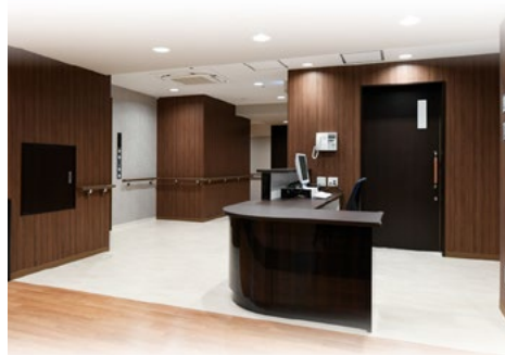
6～9階 サービス付き高齢者向け住宅 コープみらいえ中野 (コープみらい)