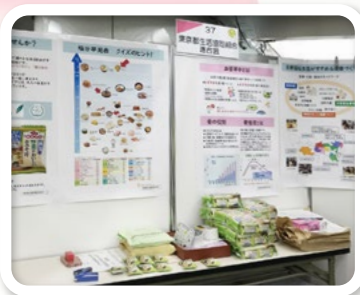
くらしフェスタ東京 交流フェスタ

消費者の安全、安心なくらしの確立をめざして、東京消費者団体連絡センター、東京都消費者月間、TOKYO消費者行政充実ねっと、多摩のくらしを考えるコンシューマーズ・ネットワークなどと連携して各種学習会や消費者行政調査活動、行政とのコミュニケーション強化などの取り組みをすすめています。また、東京都との協働事業として開催する高齢者の消費者被害防止講座や、大学生協をつうじた若者の消費者被害防止の情報発信など、消費者教育や啓蒙活動をととして、消費者がより主体的に参加する「消費者市民社会」の実現をめざしています。