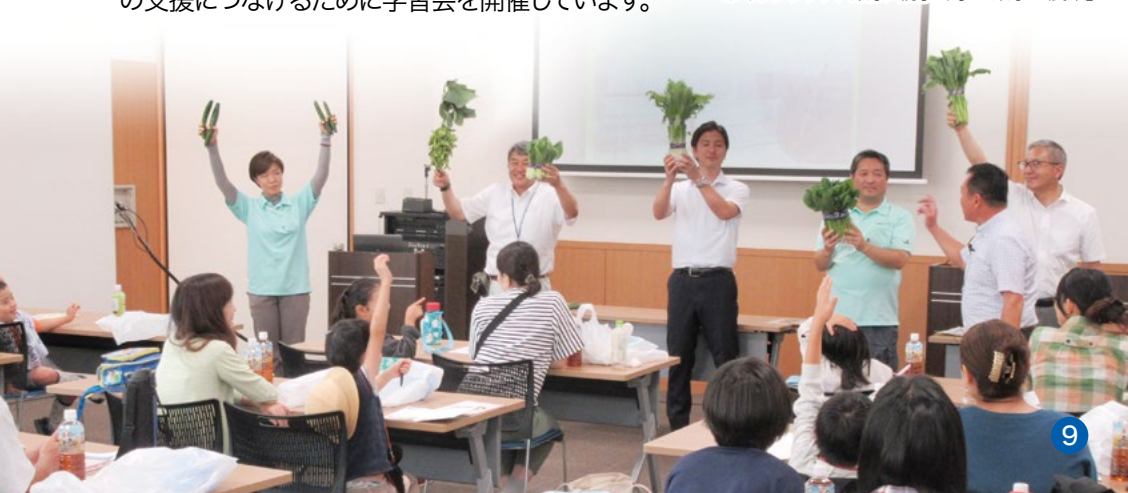
JA東京中央会との共催 あぐりフレンズ・東京「親子で学ぶ東京の農業」