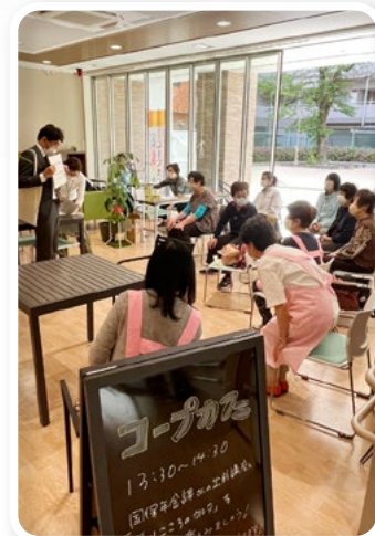
荒川区内で実施しているコープカフェ

また、都内でフードバンク活動を行う団体や社会福祉協議会などと生協との関係づくりをすすめています。現在40を超える団体や法人とつながり、定期的な交流の場の開催や情報発信、物資支援に関する情報提供などを行っています。