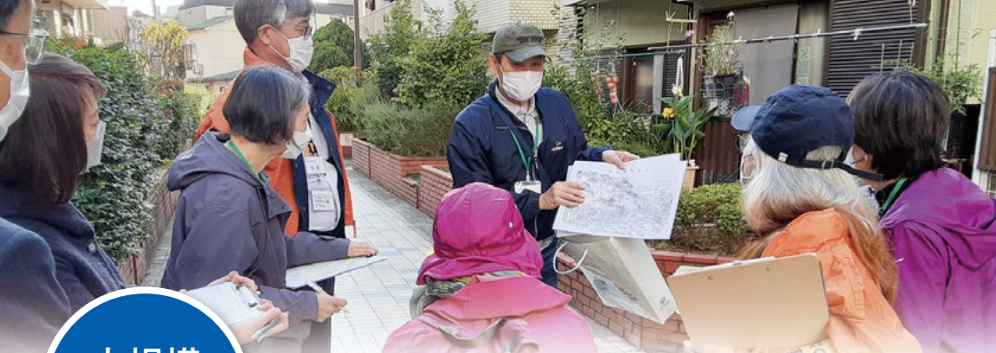
コープ災害ボランティア基礎講座「中野防災まち歩き」