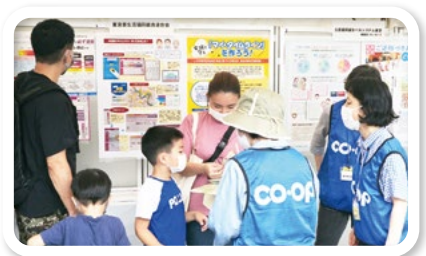
東京都・品川区合同総合防災訓練

また、生協組合員と職員を対象にコープ災害ボランティア基礎講座を開講、さらに継続的にスキルアップ講座も行い、地域での防災・減災の取り組みを広げるための活動を行っています。