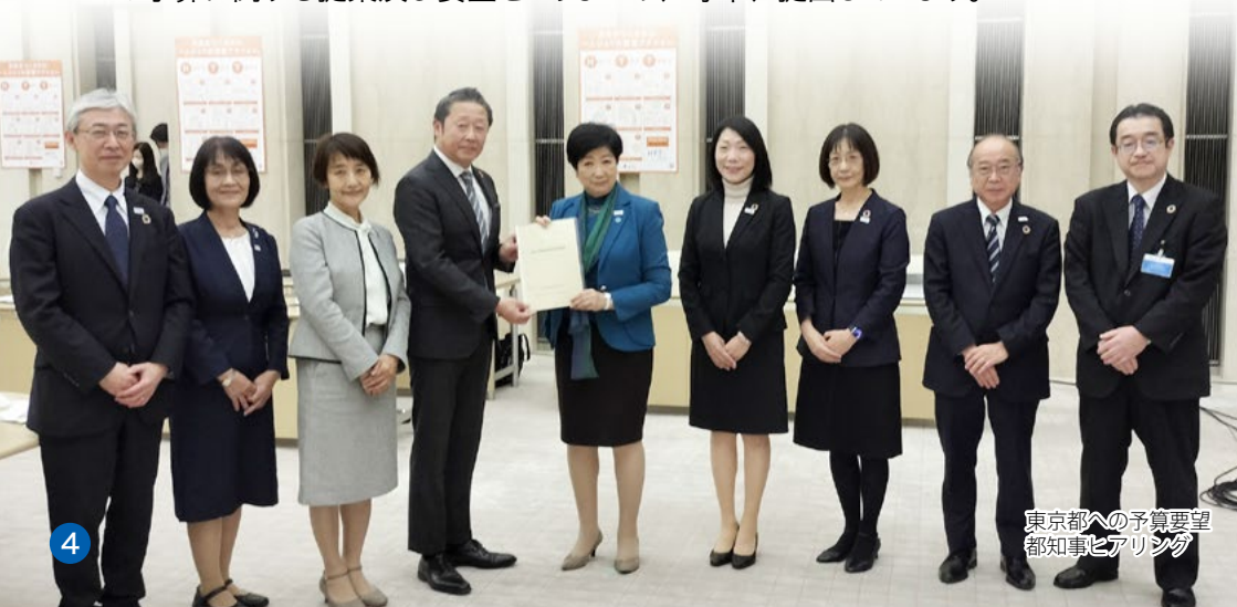
東京都への予算要望 都知事ヒアリング

また、福祉・環境・災害・子育てなど、都民のくらしの多様化・複雑化する社会的な課題に対応するために、会員生協からの要望を聞き取り、東京都の予算に関する提案及び要望をとりまとめ、毎年、提出しています。