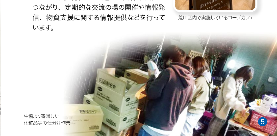
生協より寄贈した 化粧品等の仕分け作業