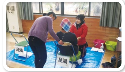
令和元年台風15号大島復興交流プログラム

災害時に多様な団体と連携して支援活動が行えるよう、平時の活動を通して諸団体とのつながりづくりをすすめています。