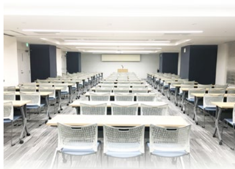
3階 東京都生協連 会議室