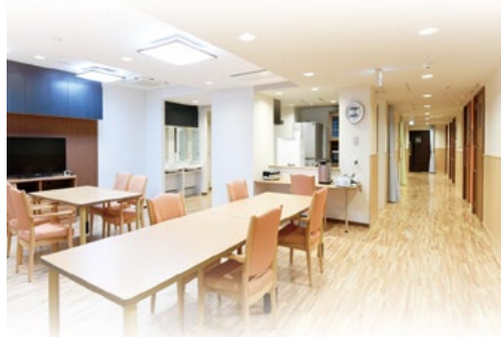
5階 グループホーム中野中央陽だまり (パルシステム東京)