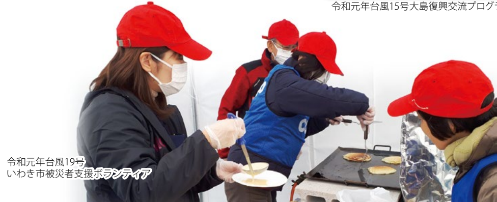
令和元年台風19号 いわき市被災者支援ボランティア