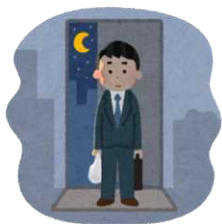
単身赴任・長時間労働