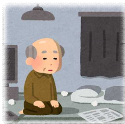
近くに頼れる人がいないひとり暮らし