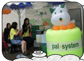
パルシステム東京 こんせん君がお出迎え

それぞれ各生協の食育の取り組みを紹介し、商品の展示や販売、試食などを行い事業や活動のアピールと利用の呼びかけを行いました。