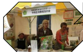
中央区消費者友の会 しいたけだしパワー