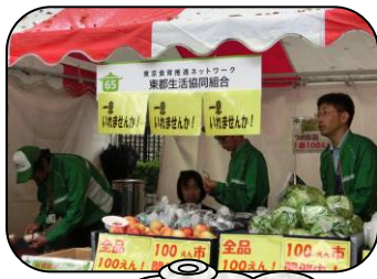
東都生協 新鮮野菜を販売