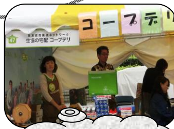
コープとうきょう コープデリを紹介