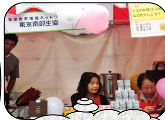
東京南部生協 初出展でアピール