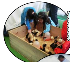
体験コーナーも いろいろ